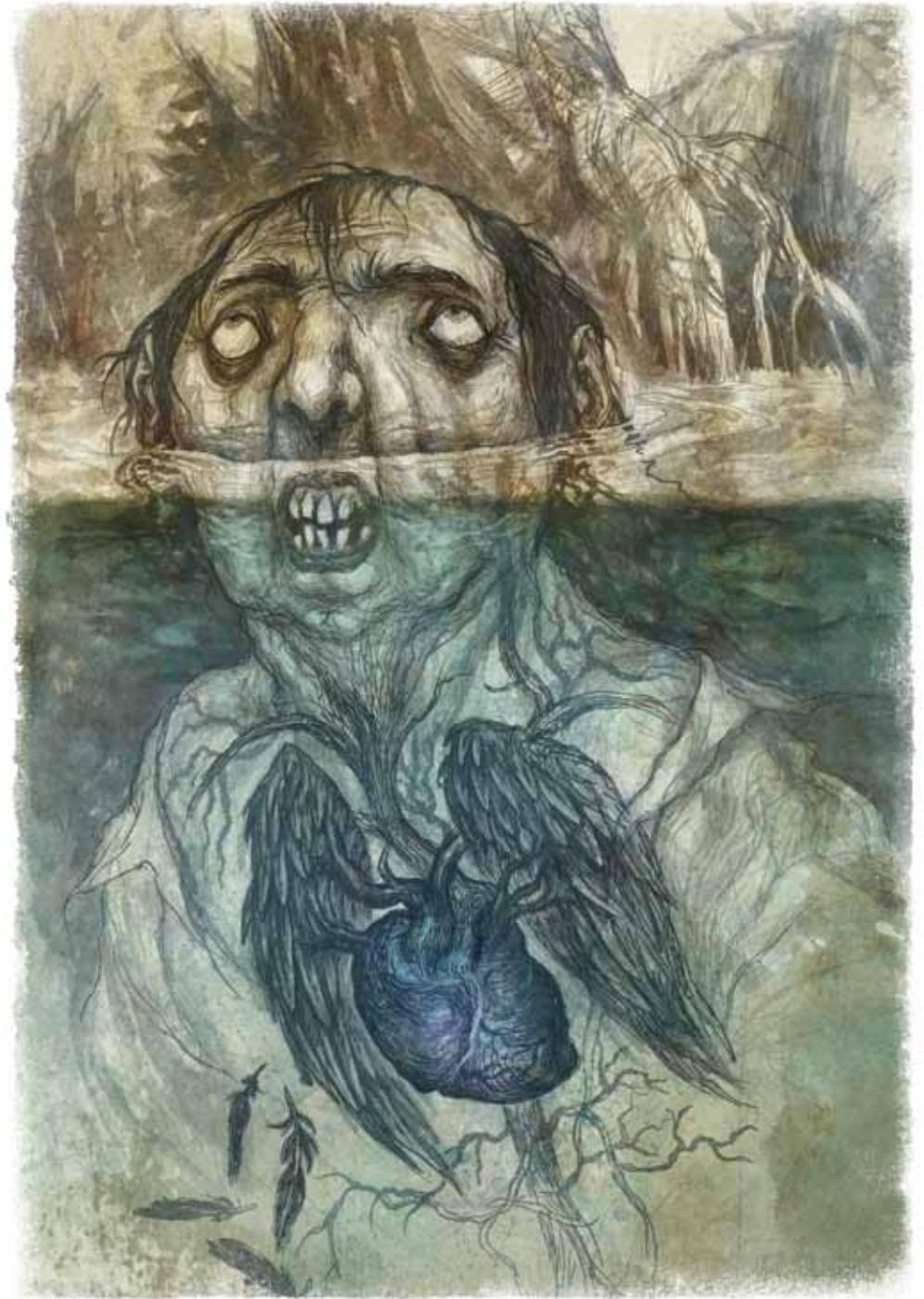
Ивица Стевановић Стасаваше валтра, лавирани туш / дигитално