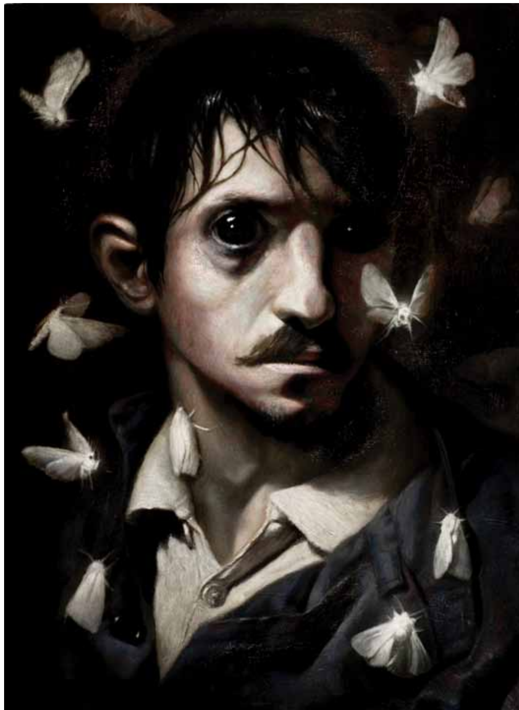
Драган Бибин Валтир Вид, уље на платну