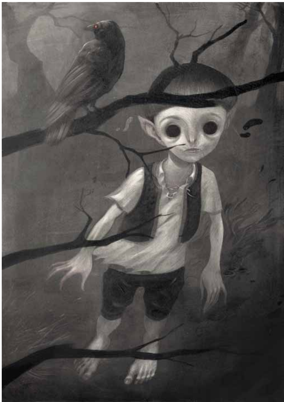
Душко Бјељац Вампирче , акрил на панелу