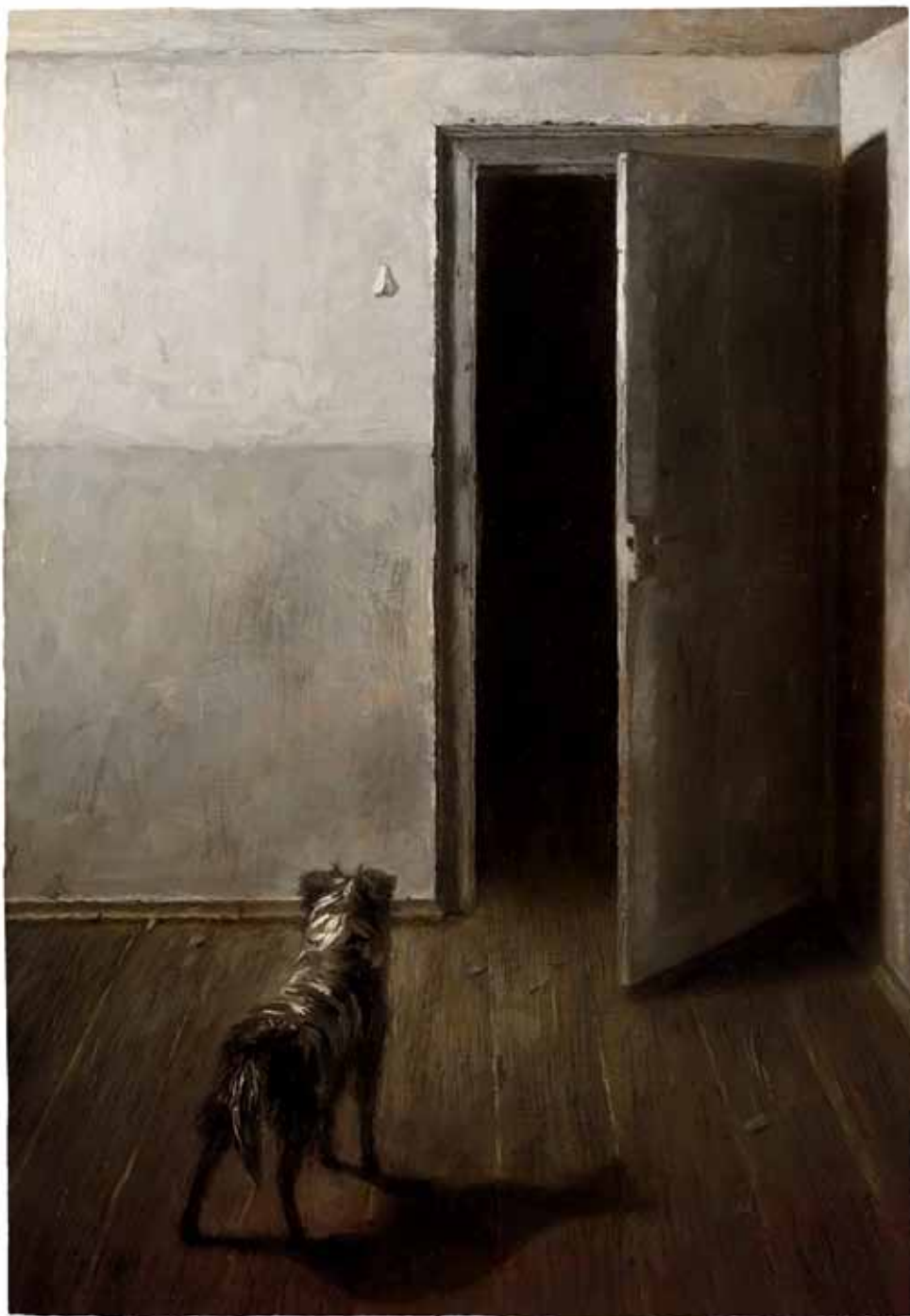
Драган Бибин Увод у ноћ, уђе на платну