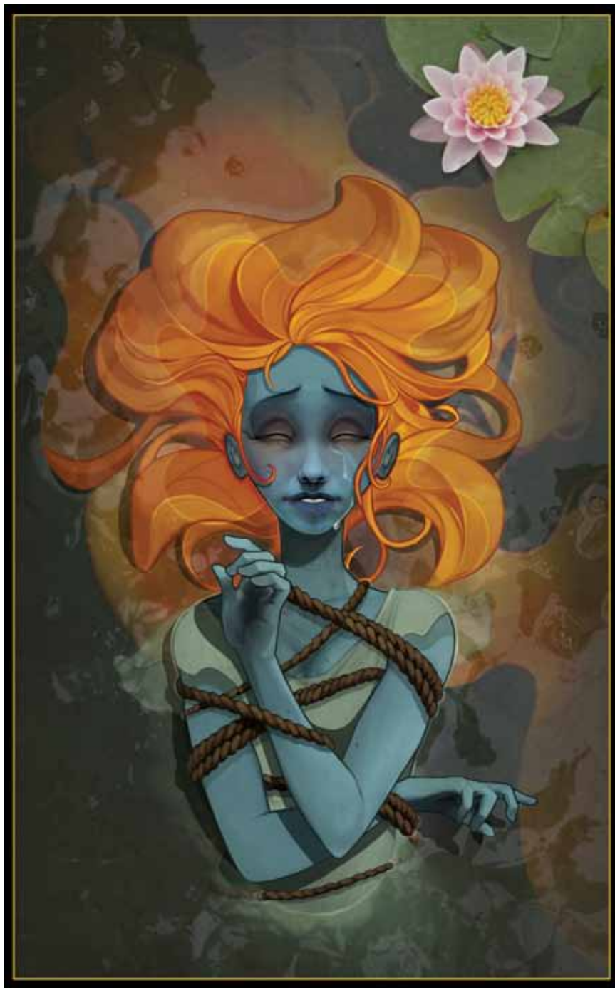
Вања Тодорић Вестница Лепа , дигитално